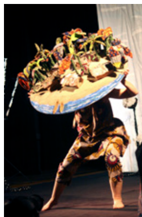
Flickan bär hela byn på sina axlar.

Efter teatern fanns det lite tid för frågor och barnen som levde med mycket i pjäsen hade också många frågor om fiskebyn och om nedsmutsning i havet.