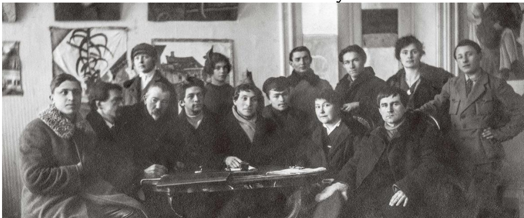
Marc Chagall på sin skola. Bilden är hämtad från Tablet magazine .