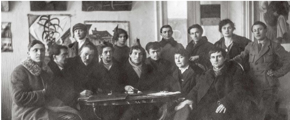
Marc Chagall på sin skola. Bilden är hämtad från Tablet magazine .

I Vitebsk ledde Marc Chagall och Kazimir Malevitj en revolutionär konstskola runt år 1919. Alla skulle bli konstnärer! Skolan är berömd och nu i maj firar den 100-årsjubileum.